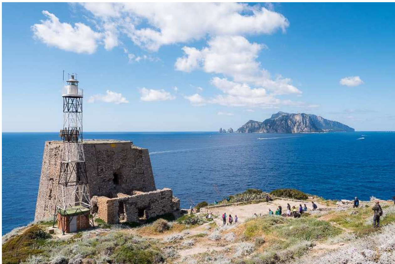
La vista super panoramica dalla torre di Punta Campanella, con l'isola di Capri e i suoi faraglioni