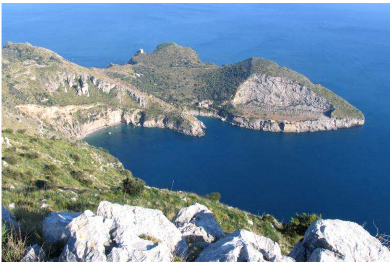
La baia di Ieranto, vista dal sentiero che percorre il crinale costiero