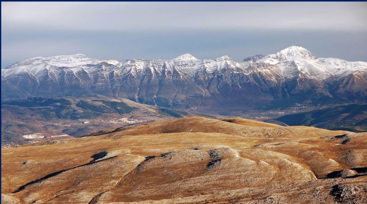
Panorama da vetta