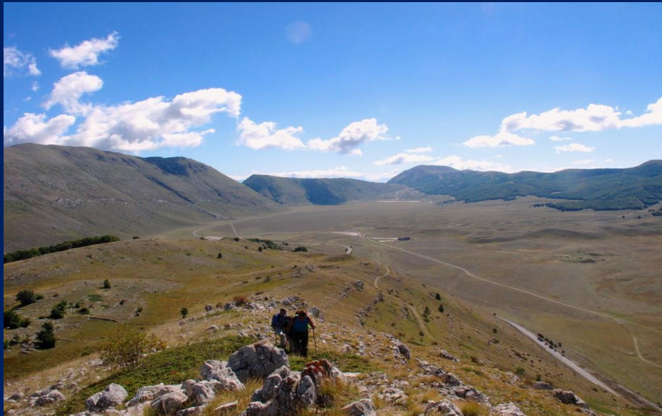
Panorami offerti sempre dalla vetta