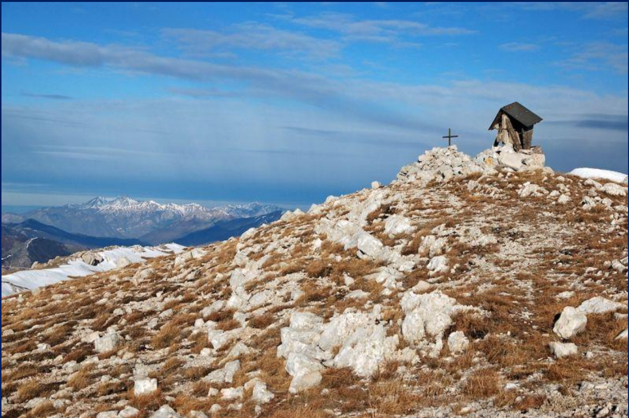
La vetta del Monte Orsello