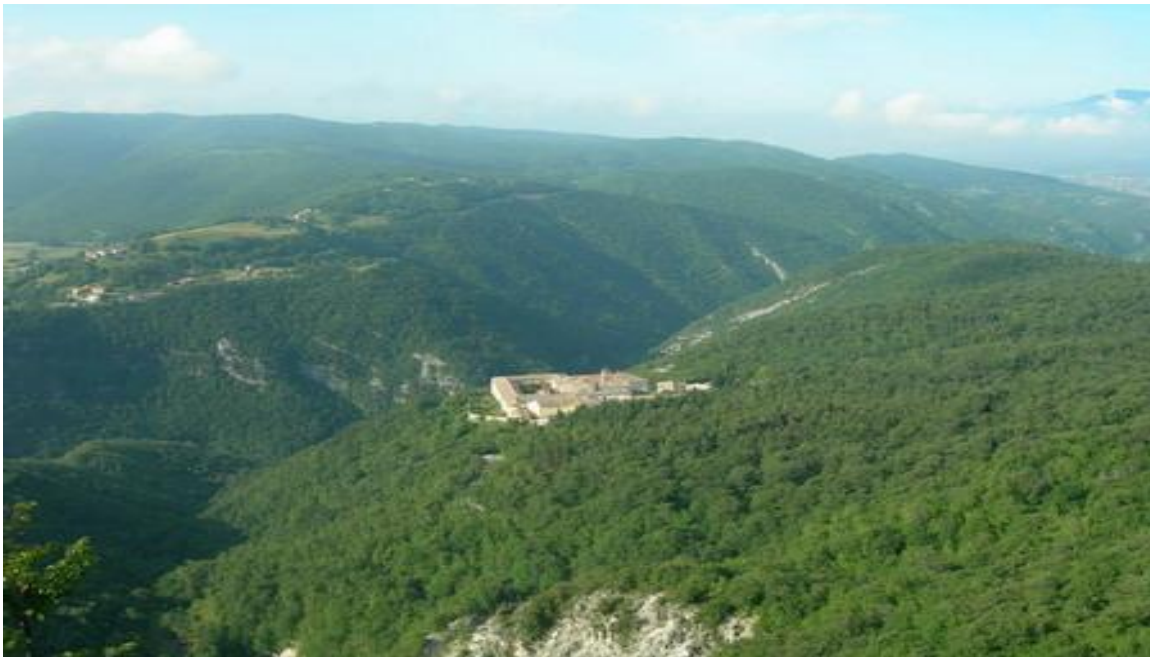
Certosa Trisulti vista dall'alto sul sentiero di salita

Il dislivello Totale e Distanza, sono sempre riferiti alla certosa di Trisulti.