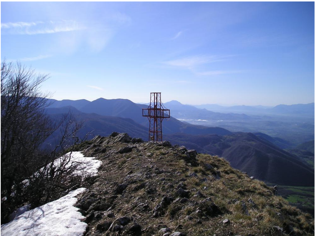
Vetta del Monte Rotonaria

Si segue la strada che da Veroli va verso la Certosa dei Trisulti, e parcheggiare l'auto nei pressi di uno spiazzo vicino a due colonne in mattoni rossi. Si segue il sentiero a sinistra molto evidente salendo verso nord per un tratto, poi si prosegue verso est e si raggiunge la sella di Vado di Porca. Posto molto panoramico, un balcone roccioso dove si vede nella sua grandezza il complesso della Certosa. Si continua tra Monte Porca e Colle del Vomero, quindi verso nord-ovest, risalendo il Vallone della Barca, fino a Sella Faito. Si costeggiano, poi le pendici sud di Monte Fanfilli fino alla sella che lo divide da Monte la Monna. Da qui in breve si arriva in vetta. Per il ritorno si ripercorre lo stesso sentiero, con una piccola deviazione, dalla sella Faito si risale il crinale nord del monte Rotonaria e seguendo il sentiero sempre molto evidente si arriva fino alla vetta (solo una targa indica la sua vetta). Da qui girare a sinistra ed in breve si raggiunge il punto dove è posizionata la croce. Posto molto panoramico su tutta la vallata sottostante e sulla Certosa dei Trisulti.