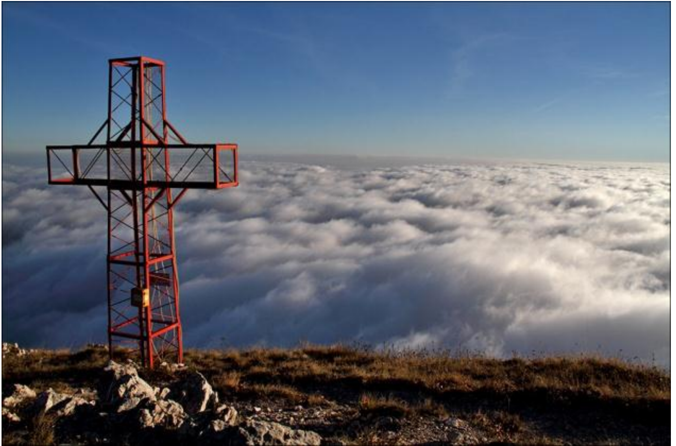
Suggestiva immagine della vetta M. Rotonaria