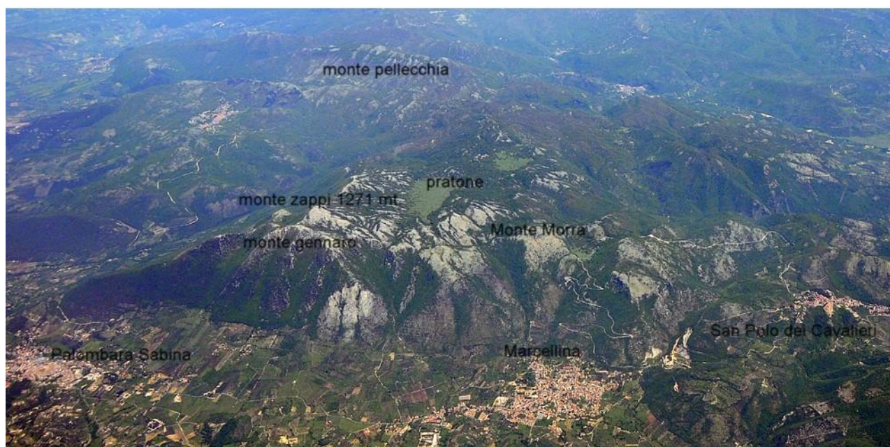
Vista Generale del "gruppo" del Monte Gennaro

Monte Gennaro o Pizzo di Monte Gennaro , è la seconda cima dei Monti Lucretili (dopo il M. Pellecchia)