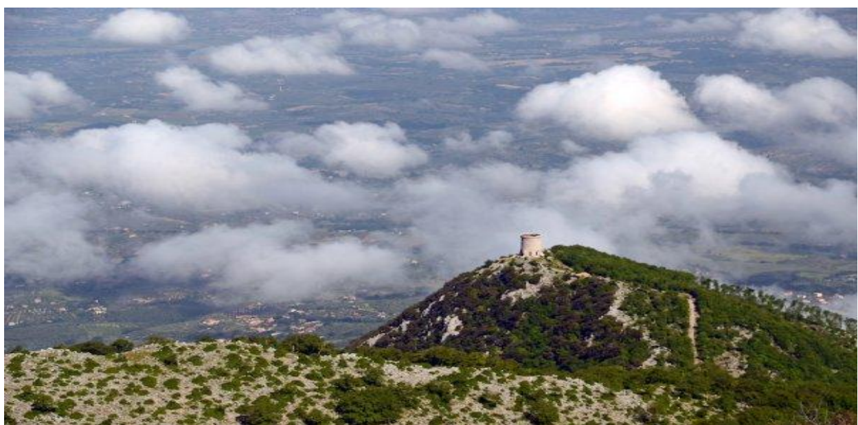
La "Torretta" (Torre Cruciani) vista dalla vetta