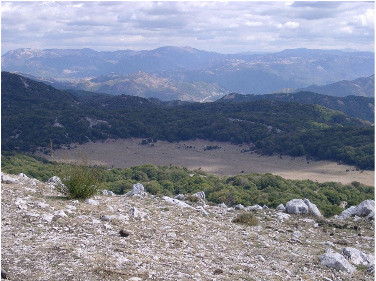
Il "Pratone" visto sulla via della vetta