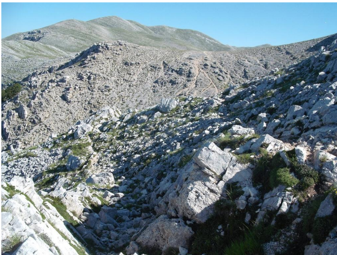
Panorama dalla vetta del M. Cornacchia sullo sfondo