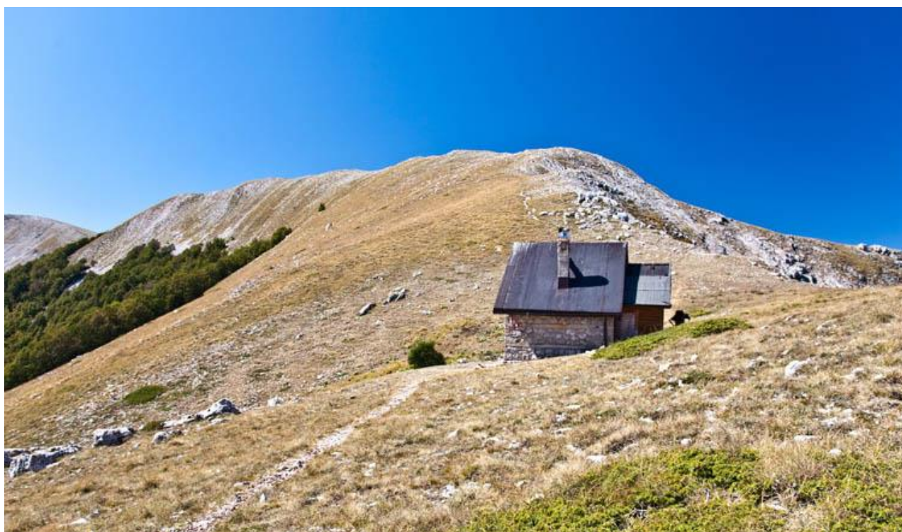
Rifugio Coppo dell'Orso

Cartografia: CARTA TURISTICA DEL PARCO NAZIONALE D'ABRUZZO, scala 1:50.000