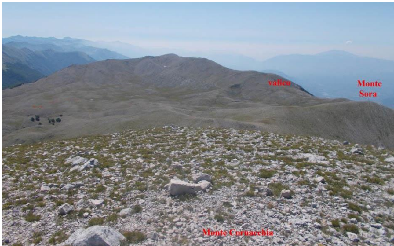
Sulla vetta del M. Cornacchia

Premessa: Il Parco Nazionale d'Abruzzo, Lazio e Molise è uno dei più antichi e vasti parchi d'Italia e consente ai visitatori di immergersi in una natura quasi incontaminata dando la possibilità di avvistare la numerosa fauna selvatica che vive in esso. Il trekking che Vi propongo dà la possibilità di esplorare una delle meno frequentate zone del PNALM ma, comunque, di uguale bellezza, attraversando valli erbose, splendide faggete con piccoli e facili passaggi tra le rocce che vi porteranno sulla cresta appena superato il rifugio "Coppo dell'Orso" da dove lo sguardo potrà spaziare a 360° su numerose cime appenniniche over 2000.