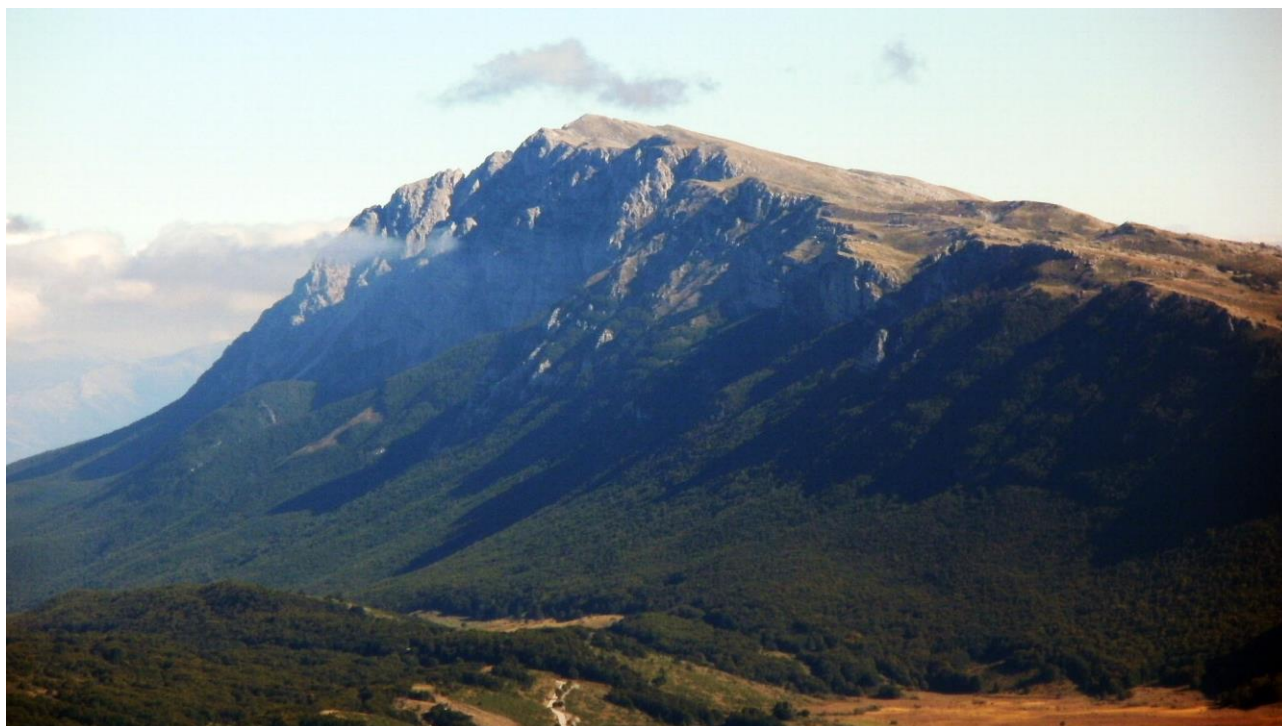
L'incombente Monte Sirente che domina la valle