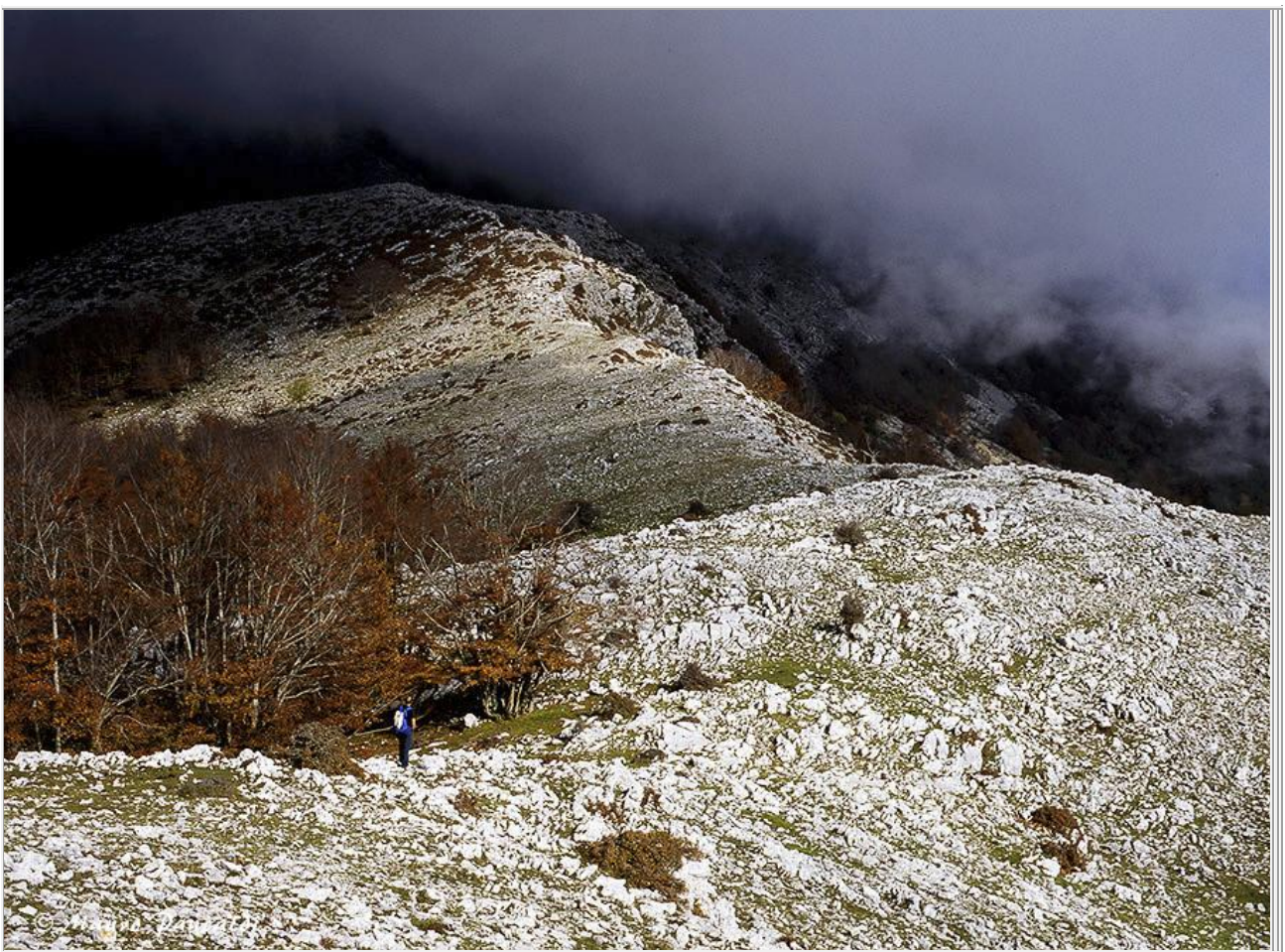
Panorama offerto sulla via della la salita

Pedule da escursionismo o scarponcini da trekking , assolutamente vietate scarpe da ginnastica o similari), zaino, abbigliamento escursionistico adatto alla stagione, giacca a vento e "pile" leggero, guanti e cappello (se inverno). Giacca impermeabile, occhiali da sole, crema solare, ricambio abiti (calzettoni e scarpe leggere da lasciare in macchina), pranzo al sacco ed acqua a volontà. Bastoncini.