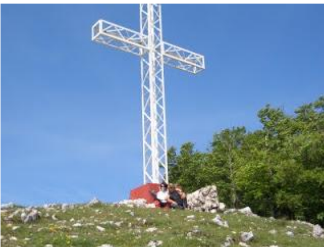
Croce di Vetta