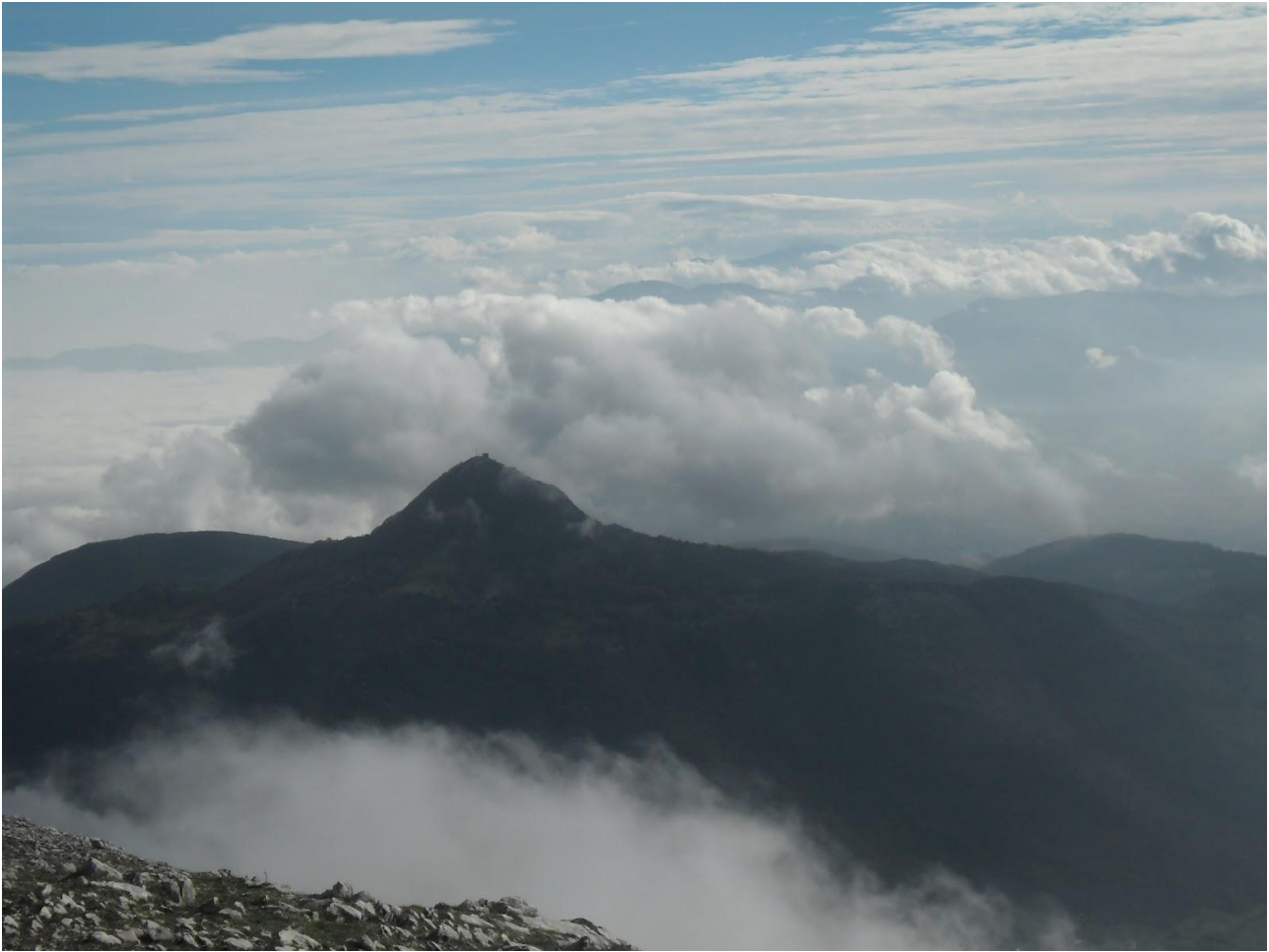
Panorama del Monte Cacume visto dalla vetta del Gemma (1457 m)