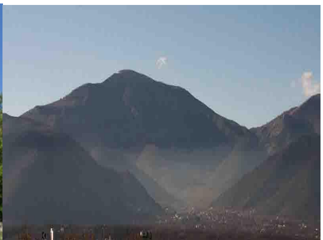
Panoramica del Monte Gemma