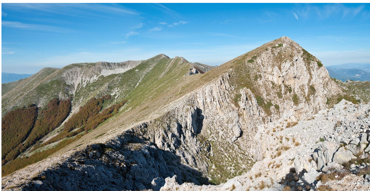
Grandiosa vista in prossimità della vetta

Una "grande anello" che attraversa tutta la piccola catena dei Monti Ernici. Uno spettacolare itinerario di "cresta" che ci permetterà di godere di viste mozzafiato su gran parte dell'Appennino Centrale. In particolare, Pizzo Deta è una montagna che, come si evince dal nome stesso, ha la forma di un dito rivolto verso il cielo. Una vetta che cambia volto da ogni diverso angolo di osservazione: dolce e apparentemente innocua dal versante Verolano, aspra e temibile dal versante rovetano. Ampie declivi erbosi e boscosi ne caratterizzano il versante sud, mentre a nord assume un aspetto prettamente dolomitico.